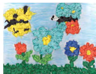
Mislav Plazanić, 3. r., PŠ Vrbica

U zimu pada bijeli snijeg, drveće je punoinja.