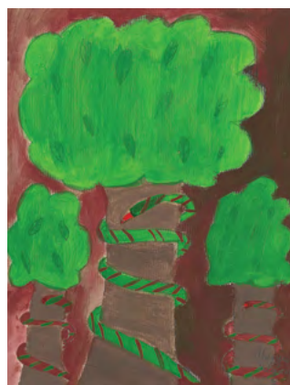
Marijana Filipović, 6. b