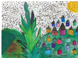
Karolina Kalić, 5. b