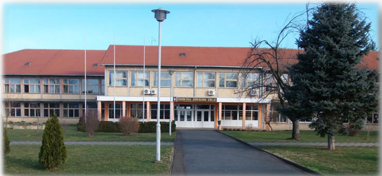
Zgrada škole u Semeljcima danas

(Iz „Dvjesto godina osnovne škole u Semeljcima“, 1986.)